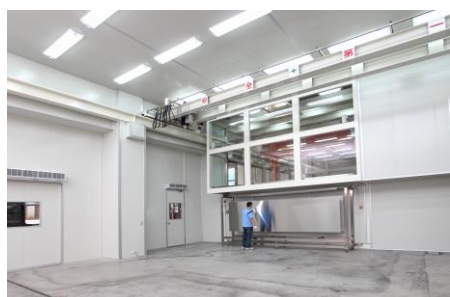
無塵室、無塵室天車

產品用途：建築外觀、帷幕牆、電梯包板、內外門窗、自動門、旋轉門、採光罩、雨庇、造型、廣告招牌、告示牌、室內裝潢、天花板、櫃台、欄杆、扶手等等。