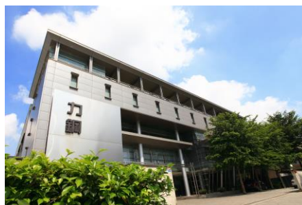
力鋼股份有限公司外觀