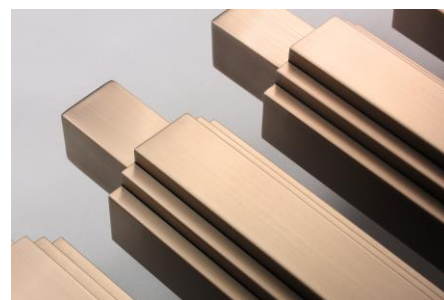
不銹鋼异形材鍍鈦加工

通過 SGS 台灣檢驗科技股份有限公司檢驗 符合 ASTM 美國材料試驗協會 CNS 國家標準規範