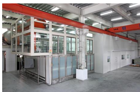
全自動超音波清洗、烘乾設備

鍍鈦特點：展現鈦金屬優良特性、硬度高、抗酸／鹼極佳、耐候性極強，色澤高雅，保養容易。