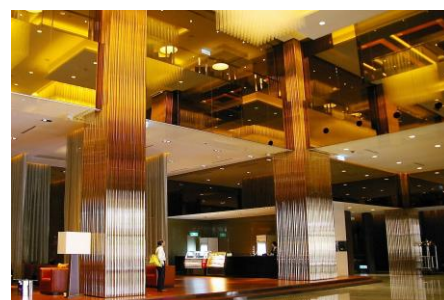
喜來登不銹鋼鍍鈦管飾柱·包板