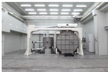
德國真空抽氣設備及超大型真空腔體

本公司真空離子鍍膜設備，有超大型真空腔體，採用德國真空抽氣設備，真空度高，工件鍍鈦前採用全自動超音波清洗、烘乾，製程全自動電腦控制，無塵室天車吊運，廠房採無塵室空間規劃及恆溫設計，被鍍工件潔淨度高，鍍膜色澤均勻，品質穩定。