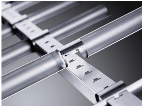
高品質圓管切口卡榫接合實例