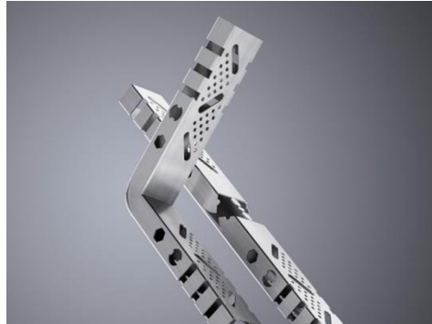
雕花開孔、折彎、接口接合實例