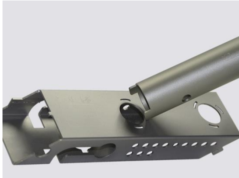
斜切、開孔、切割卡榫接合實例