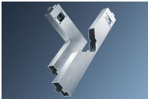
45°外角折彎內角銲接卡榫接合實例