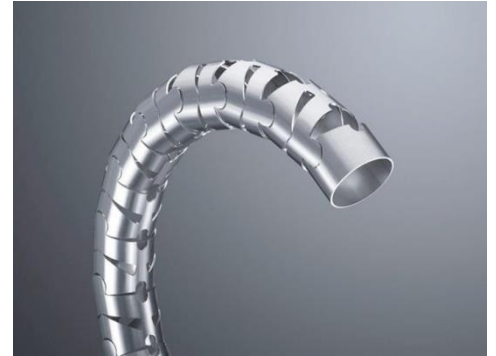
圓管雕花活動卡榫造型實例